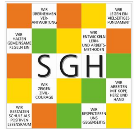
Leitbild des SGH

Die Auseinandersetzung mit dem Leitbild ist ein ständiger Prozess. Dazu gehört, uns gegenseitig Mut zu machen, einander Impulse zu geben und uns auf unsere Stärken zu besinnen. Wenn wir uns die Leitsätze stets aufs Neue erarbeiten und nach ihnen handeln, kommen wir dem Ziel einer besseren Schule für alle ein gutes Stück näher.