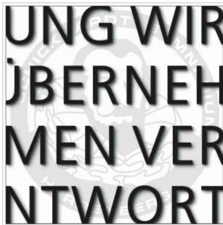
Leitbild des SGH

Das Leitbild des Schickhardt-Gymnasiums wurde im Jahr 2001 gemeinsam von allen am Schulleben Beteiligten, den Lehrkräften, Schülerinnen, Schülern und Eltern entwickelt: für uns.