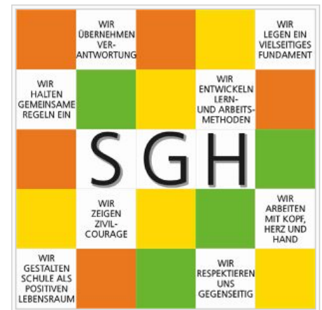
Leitbild des SGH

Die Auseinandersetzung mit dem Leitbild ist ein ständiger Prozess. Dazu gehört, uns gegenseitig Mut zu machen, einander Impulse zu geben und uns auf unsere Stärken zu besinnen. Wenn wir uns die Leitsätze stets aufs Neue erarbeiten und nach ihnen handeln, kommen wir dem Ziel einer besseren Schule für alle ein gutes Stück näher.